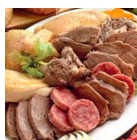
Bollito di carne